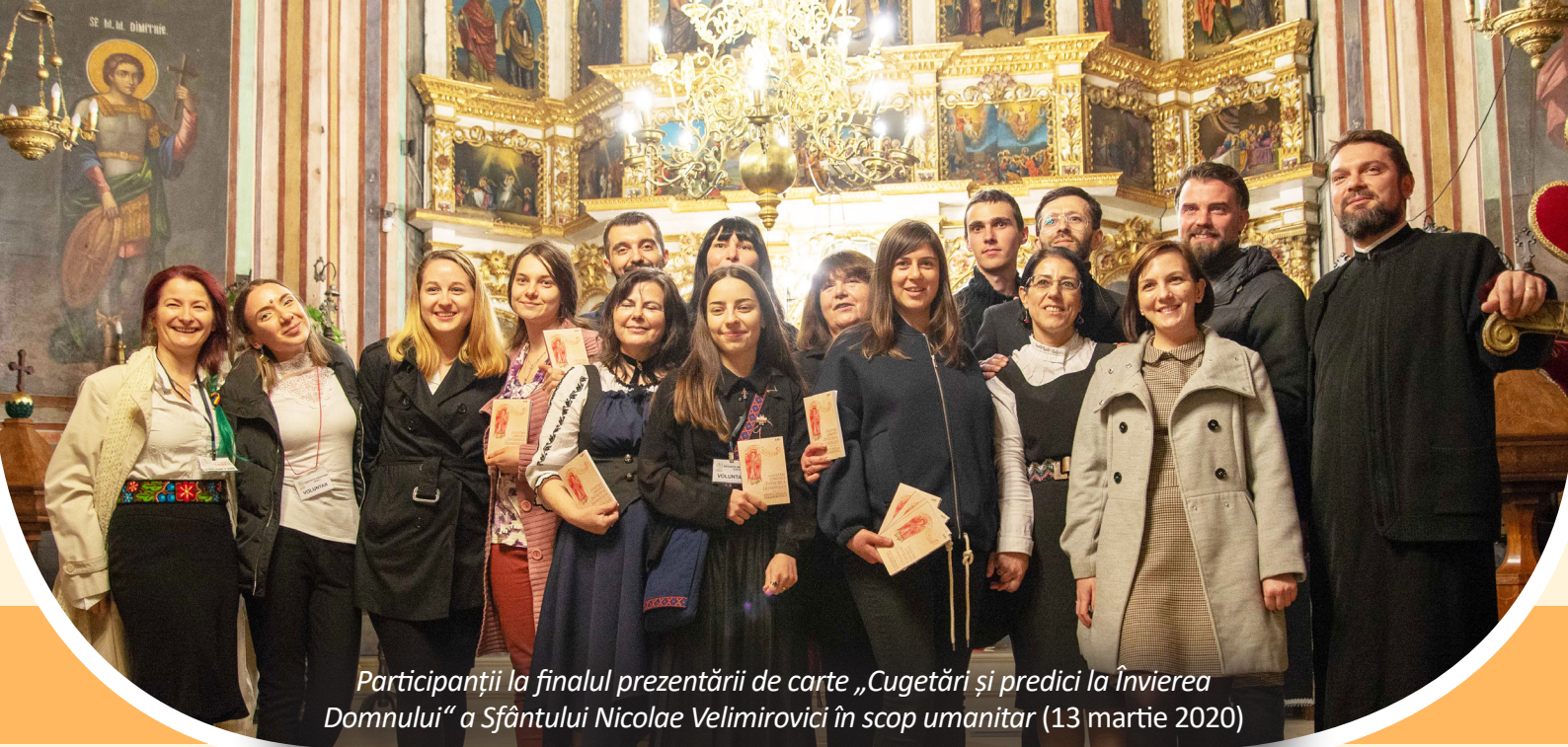
Participanții la finalul prezentării de carte „Cugetări și predici la Învierea Domnului” a Sfântului Nicolae Velimirovici în scop umanitar (13 martie 2020)